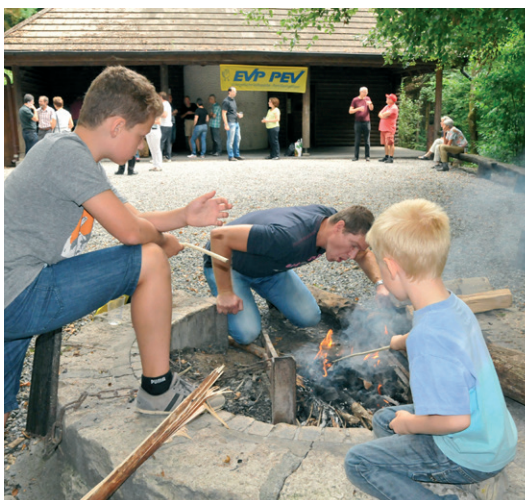
Wahlauftakt der EVP Aargau beim Aarauer Waldhaus

Das ganze Schwerpunkteprogramm 2016 der EVP Aargau: www.evp-ag.ch/politik/schwerpunkteprogramm